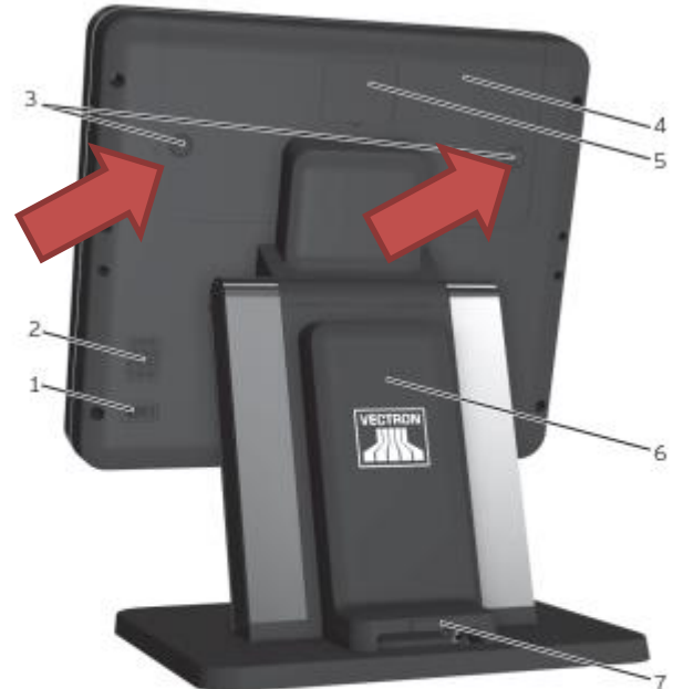
Abb. 2: Rückansicht

Bei USB-Anschlüssen ist der Steckplatz egal.